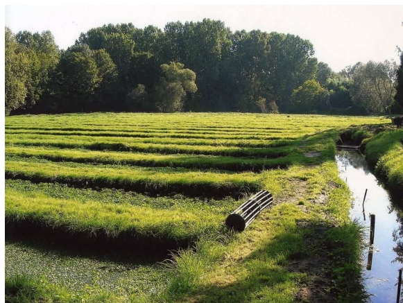
Cressonnière dans la vallée de l'Essonne

Le GAL prévoit aussi de s'ouvrir vers d'autres territoires par des actions de coopération , cohérentes avec le contenu de sa stratégie LEADER.