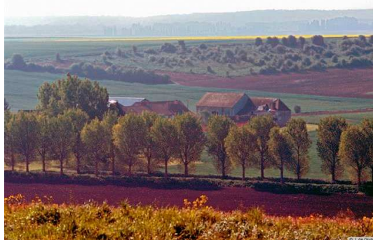
Le Val de Gally à Renne-moulin, au cœur de la Plaine de Versailles

⑥ Faire de la plaine de Versailles une zone pilote sur l'écologie territoriale : le GAL va mettre en œuvre une approche systémique, au travers d'une démarche expérimentale d'écologie industrielle. La réalisation d'un diagnostic des flux et stocks de matières et d'énergie sur le territoire, et l'accompagnement des filières les plus prometteuses (méthanisation, valorisation du fumier de cheval, développement du compostage des déchets verts des communes, utilisation d'eau non potable pour l'irrigation) en constituent le premier volet. Un deuxième volet, découlant du premier, visera à développer de nouvelles filières : accompagnement des recherches biomasse-énergie menées par la filière bois en lien avec l'ONF, production d'énergies renouvelables comme le solaire. Les actions menées s'appuieront sur les dispositifs de recherche présents sur le territoire (INRA Versailles-Grignon, AgroParisTech, etc.).