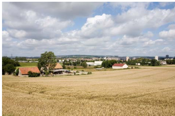
Vue des Mureaux depuis Chapet

③ Faire profiter l'agriculture du développement urbain : le parti pris est d'aider l'agriculture du territoire à tirer profit du développement de l'urbanisation grâce aux nouveaux besoins et donc aux débouchés potentiels créés. La structuration de nouvelles filières, comme la biomasse énergie et les agro-matériaux, est une opportunité importante pour l'agriculture. Le GAL incitera donc à l'utilisation de matériaux produits et transformés sur le territoire, ou a minima à l'utilisation d'éco-matériaux dans les nouvelles constructions.