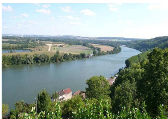
Figure 1 : Vue sur la boucle de Guernes

Liste des communes concernées et surfaces engagées dans le projet (% de chaque commune en ZPS)