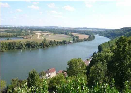
Figure 1 : Vue sur la boucle de Guernes depuis les coteaux de Rolleboise, © B.Lelaure 2008

Au cœur des méandres de la Seine (photo figure 1 ), la Zone de Protection Spéciale (ZPS) des « Boucles de Moisson, Guernes et forêt de Rosny » constitue un milieu naturel et humain original. Ce territoire, situé à l'interface des plateaux du Vexin et du Mantois, se caractérise par une richesse écologique et paysagère remarquable dont la Seine constitue la colonne vertébrale. La variété des milieux naturels, profondément marquée par plusieurs décennies d'extraction des granulats, est le support d'une forte diversité biologique.